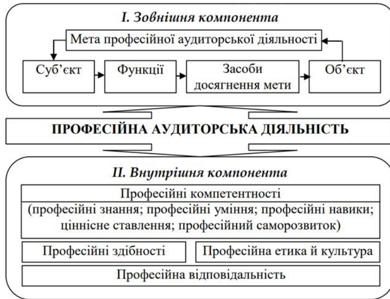
Рис. 1.1. Компоненти та елементи професійної аудиторської діяльності